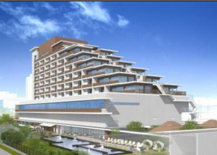
完成予想図(宿泊棟、南西より)