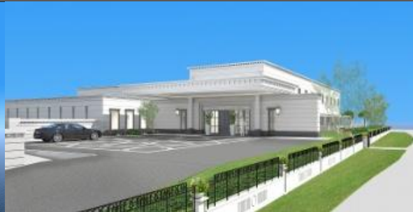
完成予想図(コンベンション棟、北西より)