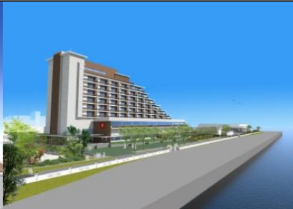
完成予想図(宿泊棟、北西より)