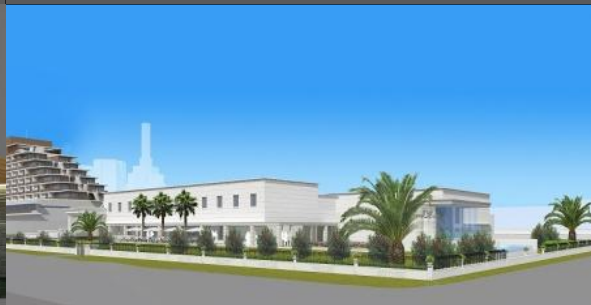
完成予想図(コンベンション棟、南西より)

株式会社ラススイート(代表取締役社長:関 寛之)は、平成24年11月に神戸市の公募「新港第一突堤用地 借受人」(平成24年6月)により、事業者を選定され、都心・ウォーターフロント 新港第一突堤用地において、平成26年2月3日、ホテル・健康増進施設・コンベンションホールなどの複合施設「ラススイート神戸新港第一突堤プロジェクト」の建設に着手しました。