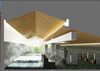
完成予想図(大浴場)