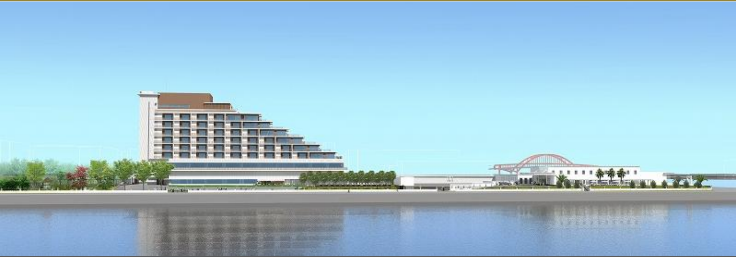
完成予想図(南西上空より)