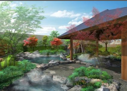
完成予想図(露天大浴場)